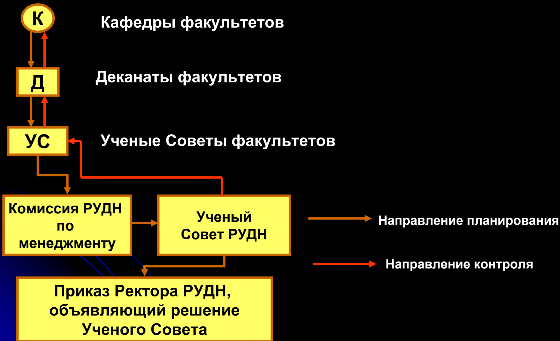
Схема обеспечения отчетности и планирования Программы интернационализации РУДН